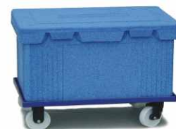
možnost převážení termoportů