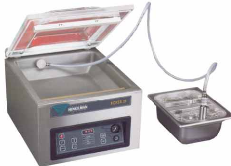
otevřít a znovu použít