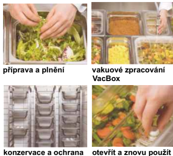
příprava a plnění