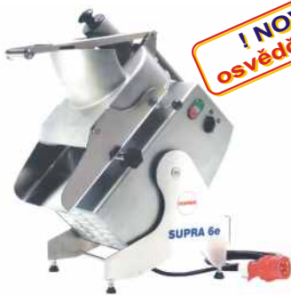
provedení krouhač s nástavcem UGS

vyrobena z nerez ušlechtilé oceli, vysoce hodnotné ozubené prvky zaručují nehluchý chod a dlouhou životnost stroje, různá přídatná zařízení se snadno a rychle připojují na hnací jednotku, která má otáčky hřídele 140/280 ot./min.